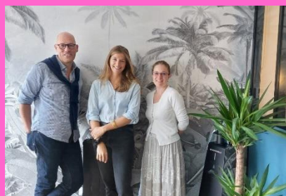
Equipe EPOCA, développement d'un système (objets connectés) validé par l'ARS Ile de France